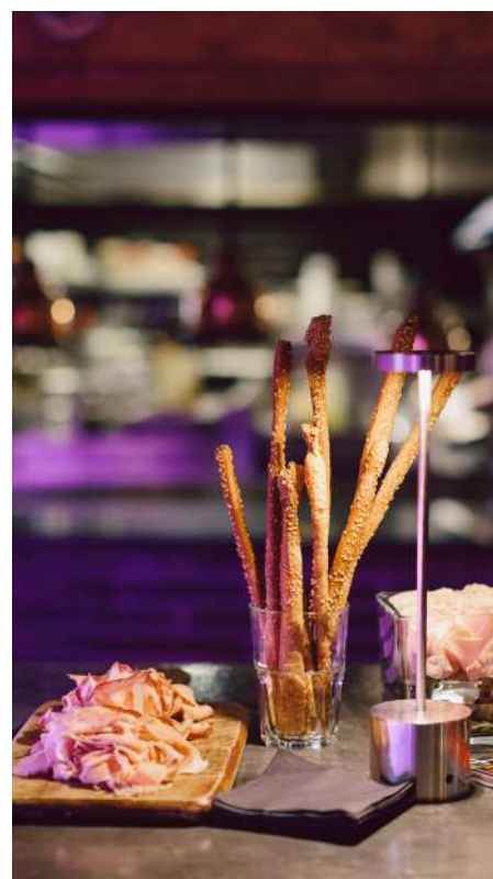
Le Next Door (privatisation séparée possible) Bar attenant au restaurant