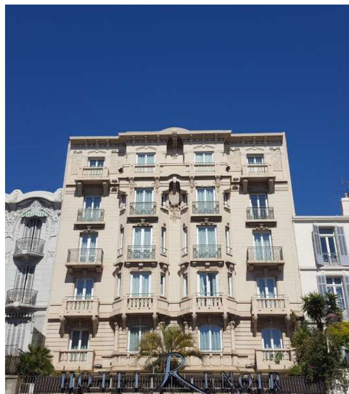
Suite et façade extérieure