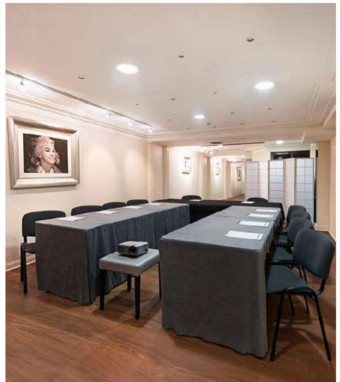
Salle de séminaire