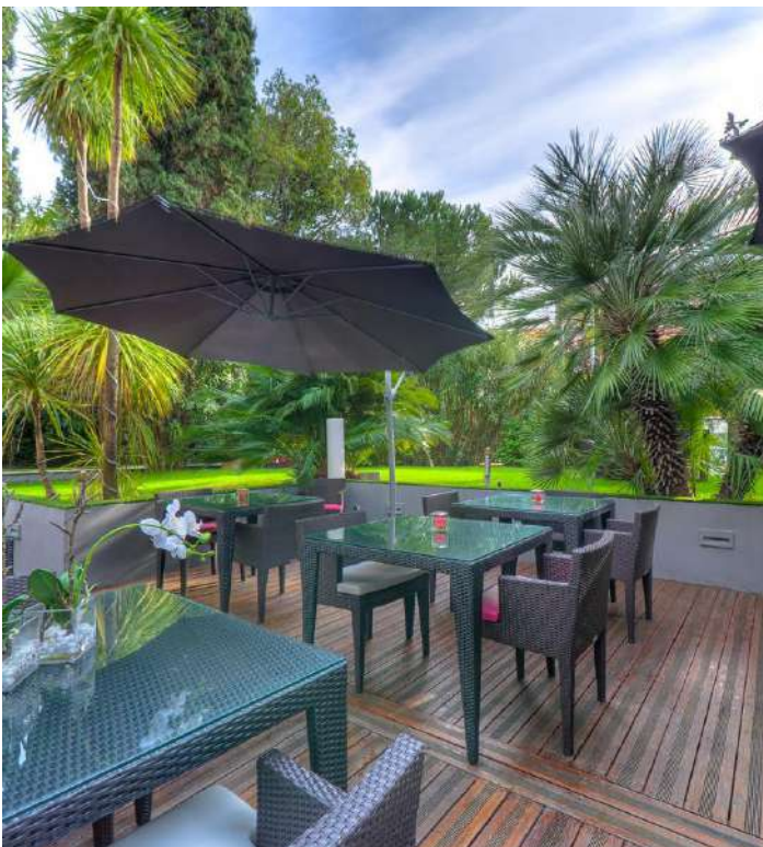
Un jardin arboré avec terrasse.