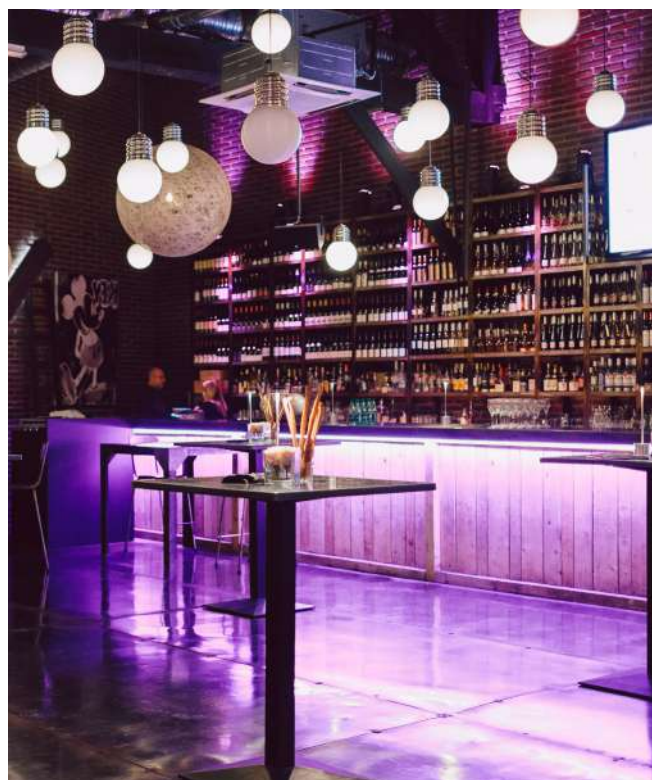
La salle de restaurant Grande salle à la décoration singulière