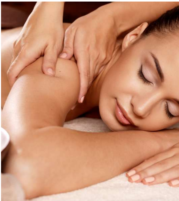
Détente et relaxation au CSpa